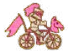
Illustrazione in copertina: Ufo Cinque; grafica brochure: Chiara Coscia. Fotografie di: Giorgio Ventura, Giovanni della Ceca, Paolo Biancofiore, Andrea Baldassarri.

Dove il prezzo non è specificato, l'ingresso agli eventi è ad offerta libera. Il contributo che lascerete ci aiuterà a finanziare quest'edizione del festival e a continuare il percorso negli anni a venire.